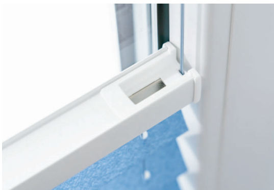
VS2 tüüpi voldikkardinaltel on üleval servas magnetid.