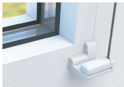
kronstein raamile paigalduseks