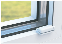
paigaldusplaat (ainult VS2)