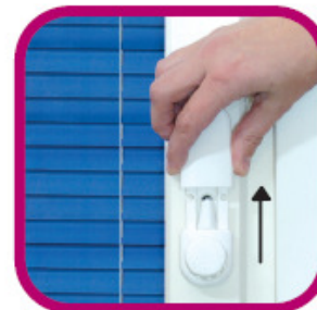
Tõsta kate üles.